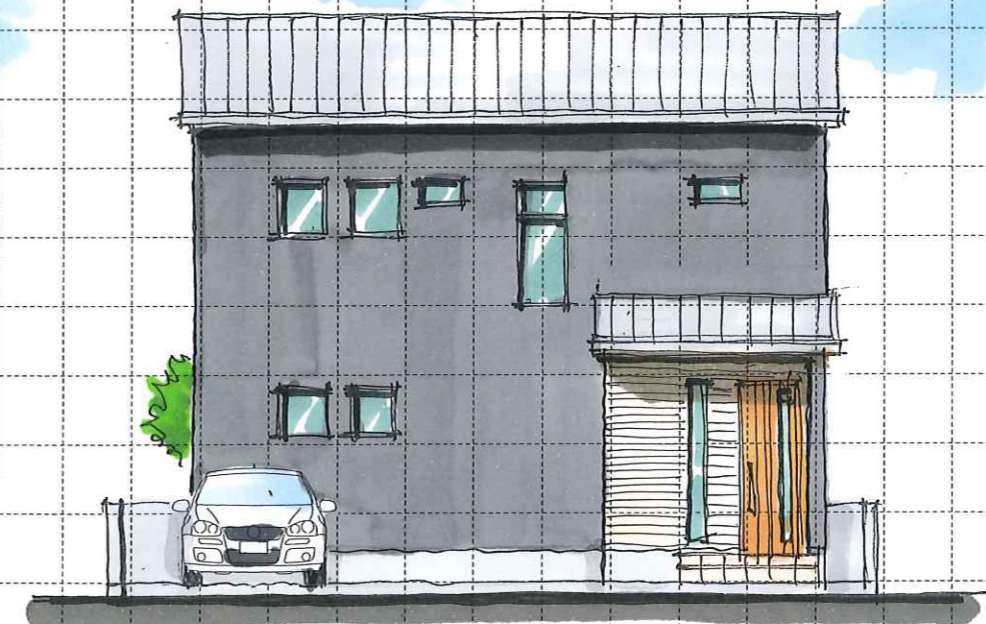
B TYPE North elevation (北)

Project Name 大和町『NEW TOWN』23号地 PLAN ※参考プラン