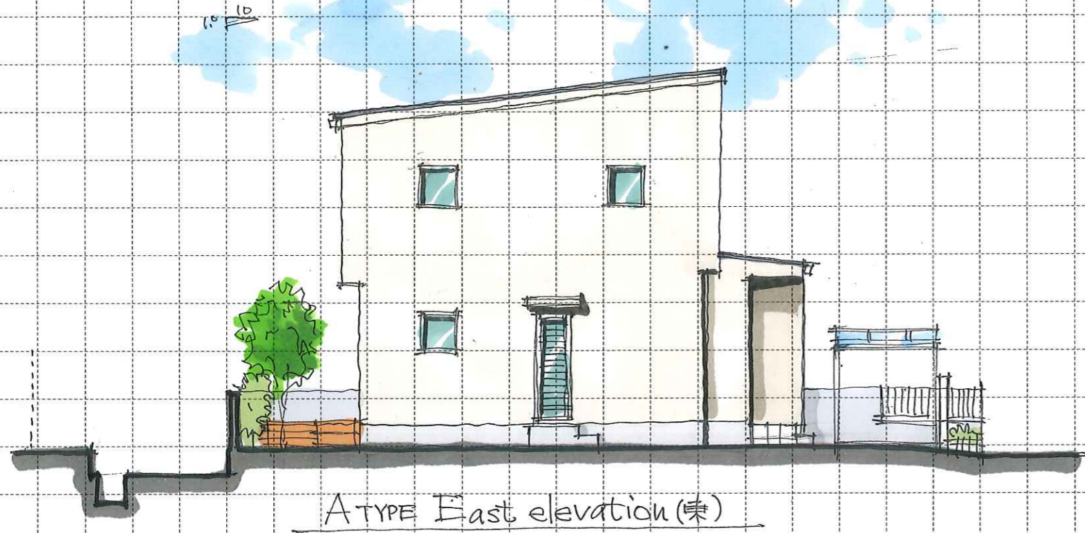
A TYPE East elevation (東)