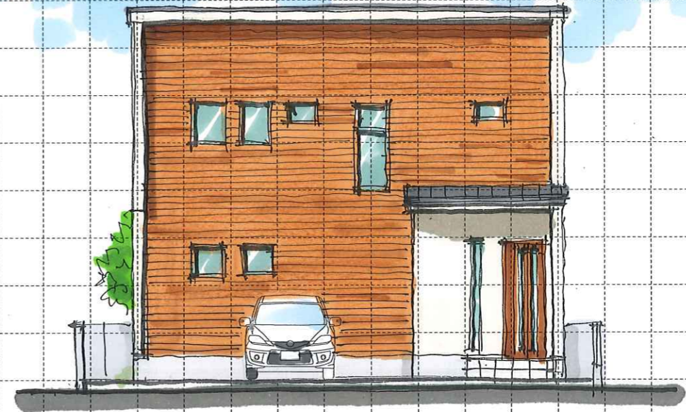
A TYPE North elevation (北)