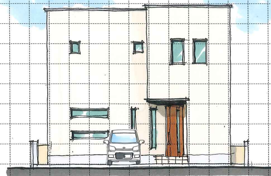
North elevation (北)