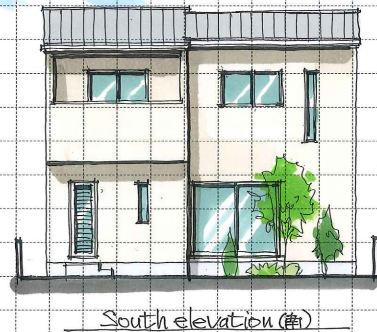
South elevation (南)