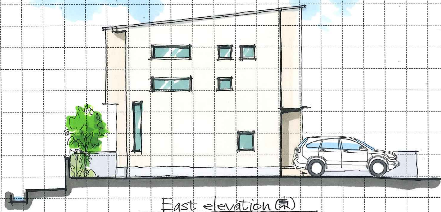
East elevation (東)