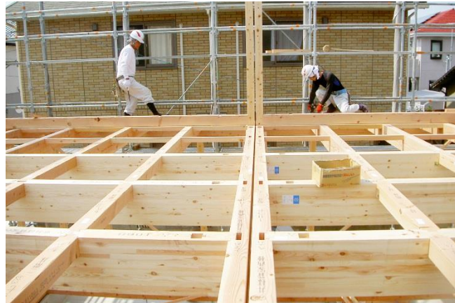
各住戸界壁は二重壁になっています。