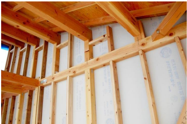
柱と柱の間にも、石膏ボードを貼っています。 (この後、右の写真のように遮音断熱用ロックウールマットを壁の両側にそれぞれ充填し、その壁面に、2重に強化石膏ボードを貼ります。屋根裏面にも強化石膏ボードを貼ります。)