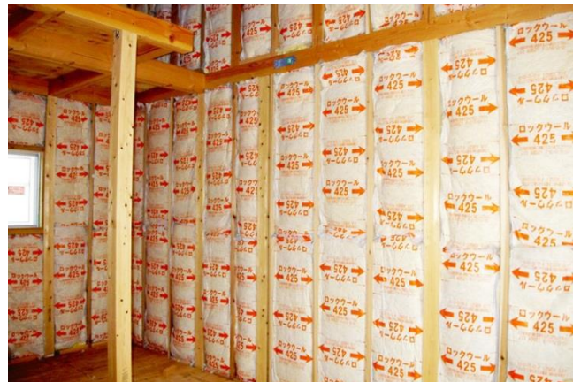
ロックウールマットは比重が高く、遮音性の高い断熱材です。