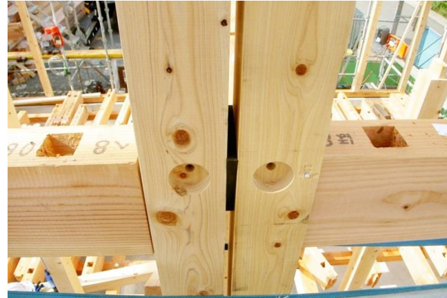
各戸界壁は柱が2本並んで建ちます。